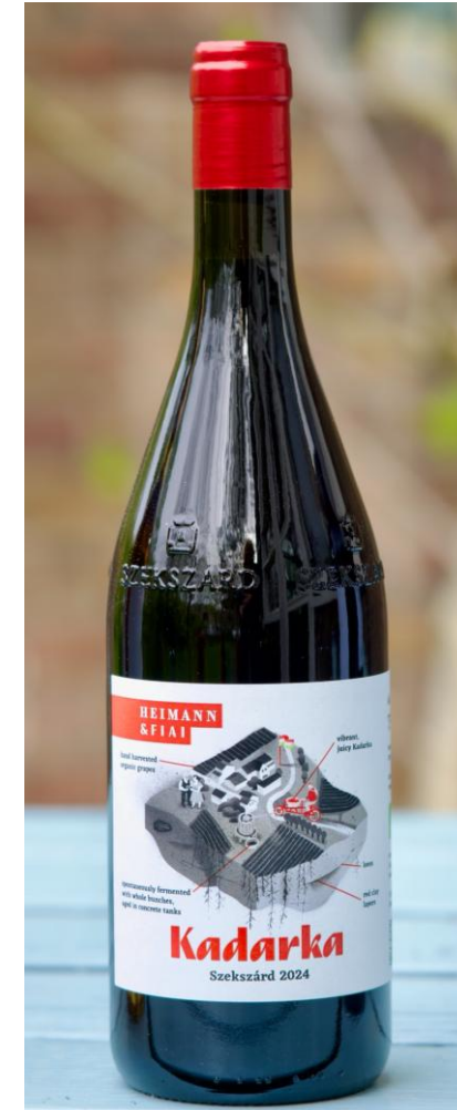
Beeld: Ilse Swank